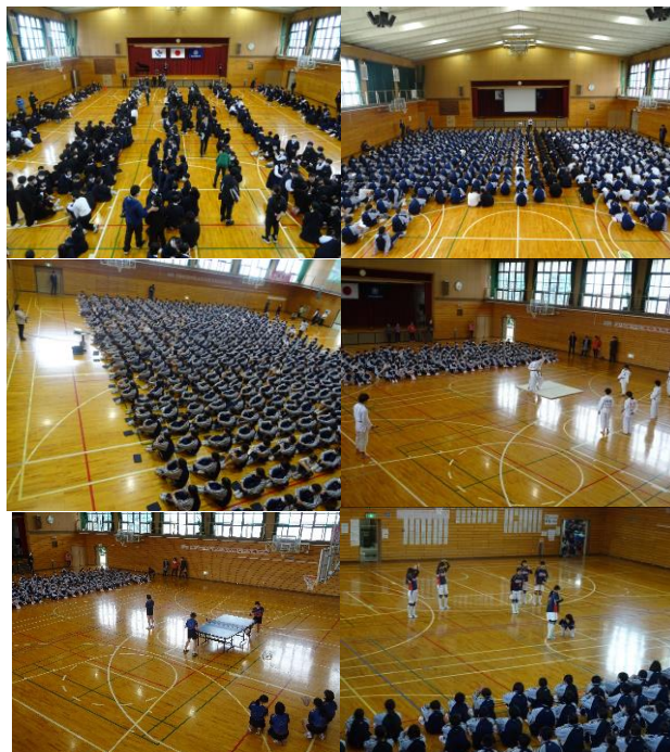
新入生歓迎会、全校ガイダンス、部活動説明会の様子

4月9日(火)に新入生歓迎会と全校ガイダンス(給食と清掃について)、11日(木)には2回目の全校ガイダンスが行われました。562名もの生徒が共に生活をする学校です。一人一人が気持ちよく学校生活を送るため、そして協力しながら自分自身の力を高めていくためには、共通に理解しておくことや守るべきルールやマナーがあります。新入生の入学にあわせて、そのことを確認するのが全校ガイダンスです。希望制となった部活動の説明会もありました。